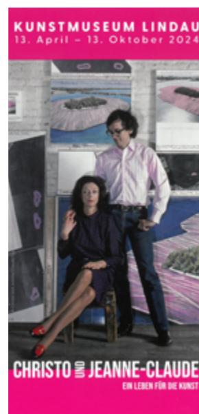
Flyer Kulturhighlight 2024