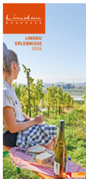
Lindau Erlebnisse 2024