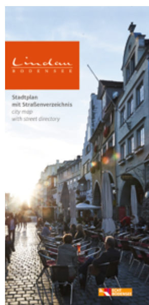
Stadtplan A3 gefaltet

_____ DE _____ EN _____ IT _____ ES _____ FR _____ NL