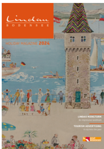
Urlaubsmagazin 2024 Englisch

_____ Stück _____ Karton (Packmenge/Karton: 30)