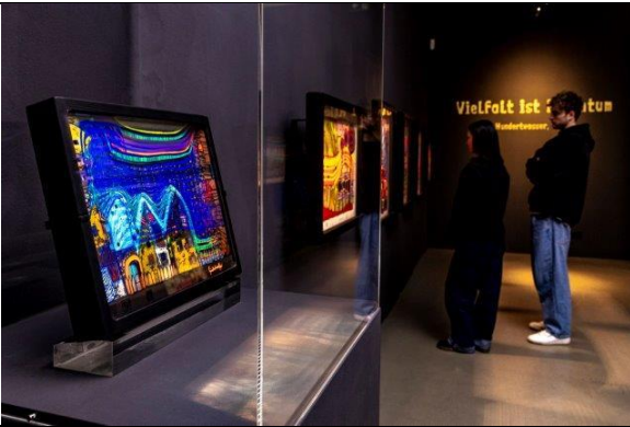
Kunstforum Hundertwasser in Lindau: Blick in die Ausstellung „Hundertwasser - Die Kunst der Vielfalt“.