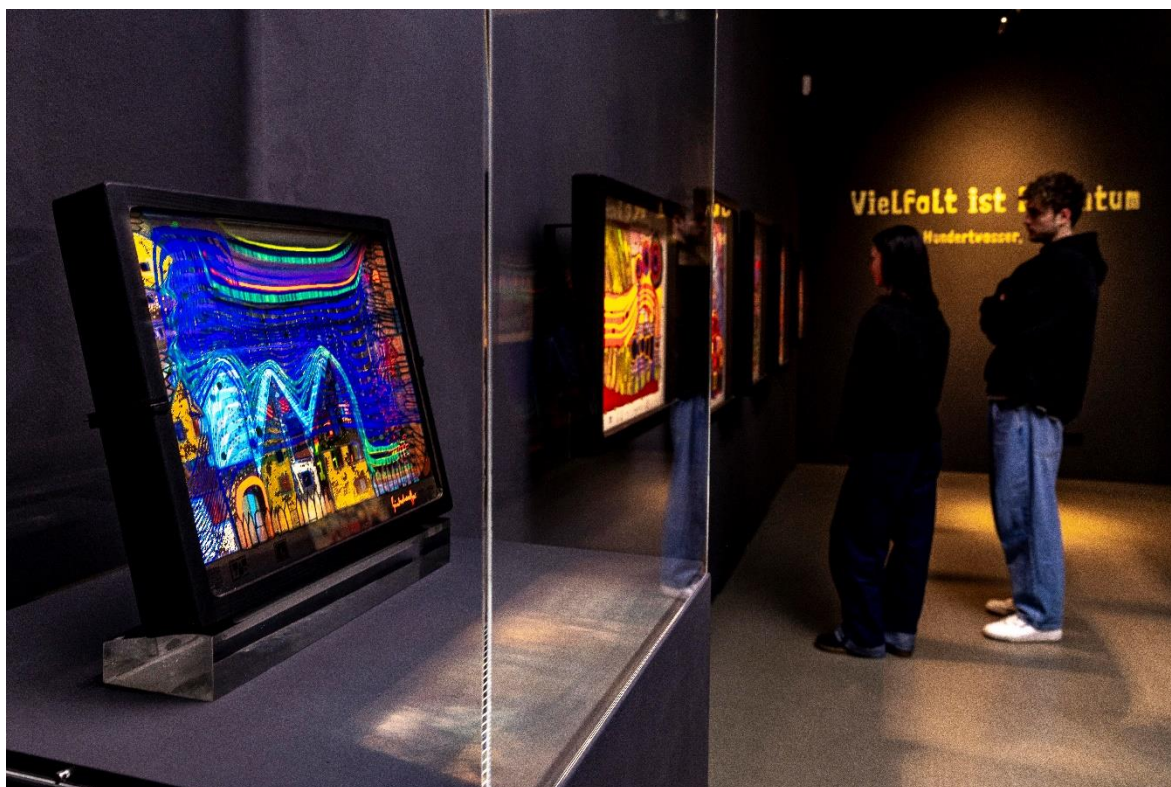
Kunstforum Hundertwasser in Lindau: Blick in die Ausstellung „Hundertwasser - Die Kunst der Vielfalt“.