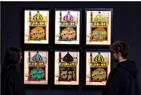
Kunstforum Hundertwasser in Lindau: Blick in die Ausstellung „Hundertwasser - Die Kunst der Vielfalt“.