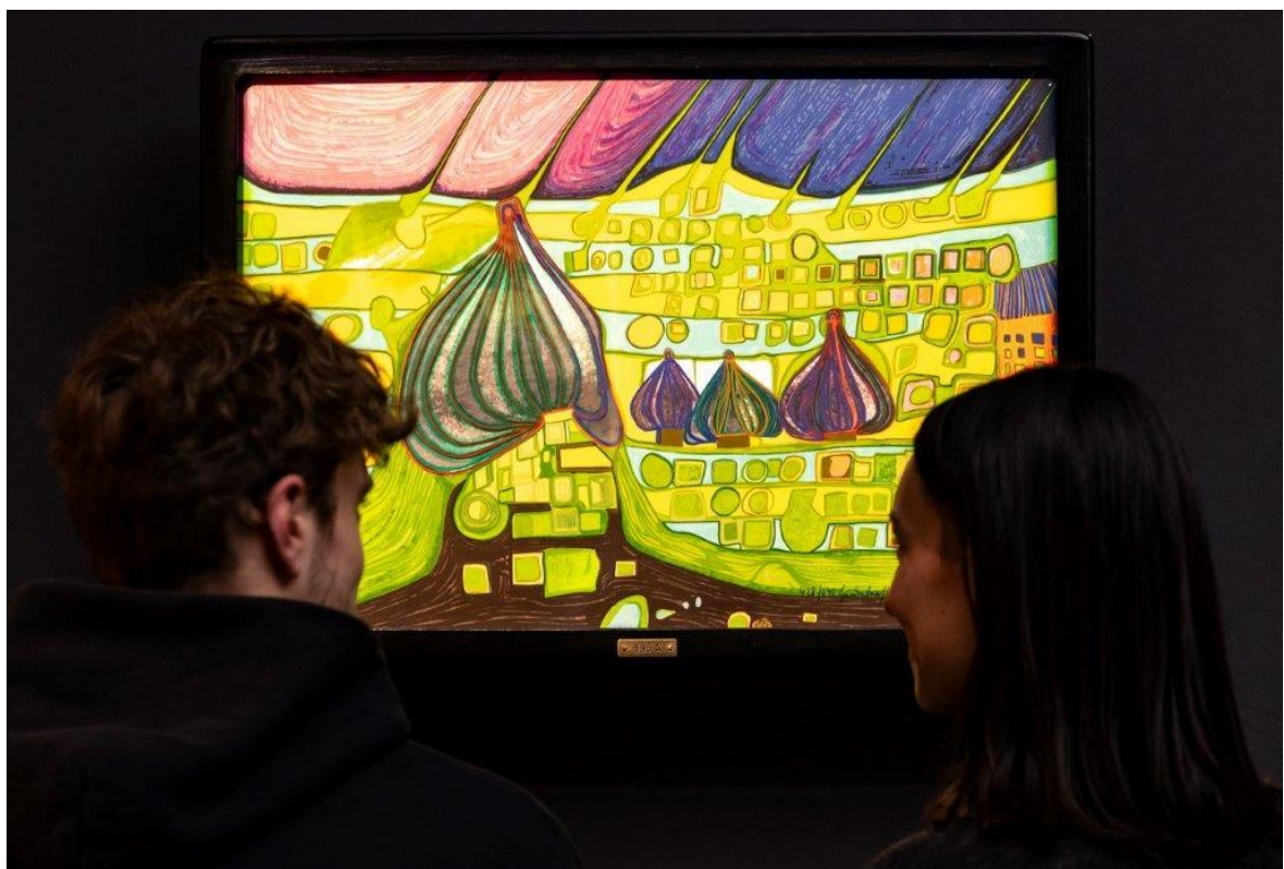
Blick in die Ausstellung „Die Kunst der Vielfalt“ im Kunstforum Hundertwasser in Lindau.