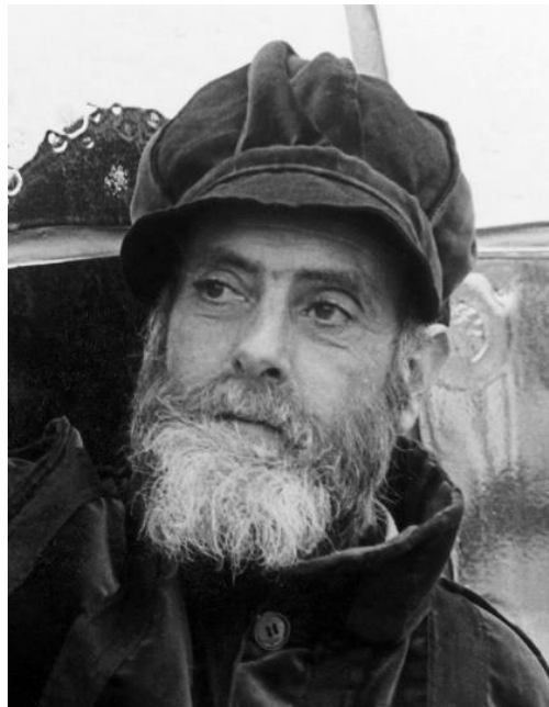
Porträt Friedensreich Hundertwasser

Er wandte sich gegen die geometrisch gerade Linie und das Rastersystem einer funktionellen Architektur und realisierte Architekturprojekte, die von seinem Einsatz für Vielfalt anstelle von Monotonie zeugen, für Romantik, für das Organische und für Unregelmäßigkeiten. Er setzte sich für die Erhaltung unserer natürlichen Lebensräume ein und forderte einen „Friedensvertrag mit der Natur“. Hundertwasser war ein wichtiger Vorläufer der Umweltbewegung und Vordenker eines „ökologischen Zeitalters“.