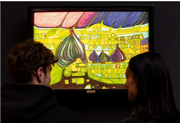
Kunstforum Hundertwasser in Lindau: Blick in die Ausstellung „Hundertwasser - Die Kunst der Vielfalt“.