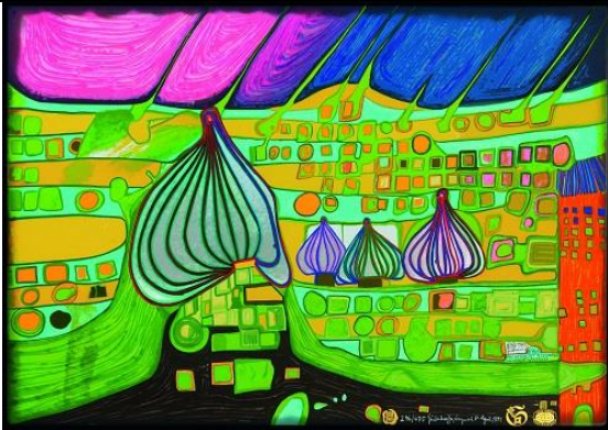
Hundertwasser 696A YELLOW LAST WILL • Siebdruck • © 2026 Gruener Janura AG, Glarus/CH