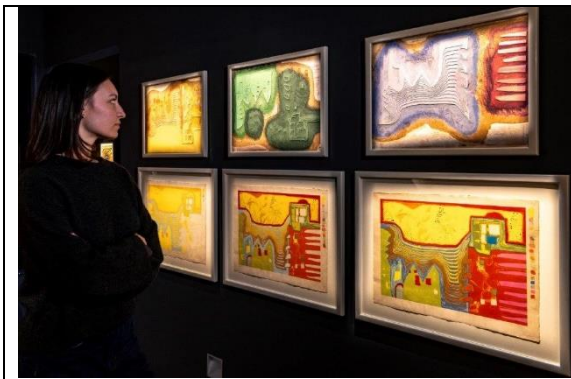
Kunstforum Hundertwasser in Lindau: Blick in die Ausstellung „Hundertwasser - Die Kunst der Vielfalt“.

Bilddaten zum Download finden Sie hier: www.kultur-lindau.de/presse